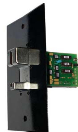
рис . 1

Конструктивно универсальный считыватель пластиковых карт выполнен как устройство для врезной (скрытой) установки. Устройство монтируется на поверхности, граничащей с блокируемым дверным проходом. Крепление к поверхности осуществляется через специальные монтажные отверстия, расположенные на лицевой передней панели считывателя. Внешний вид установленного считывателя представлен на рис.1 Схема подключения считывателя-контроллера показана на рис.2